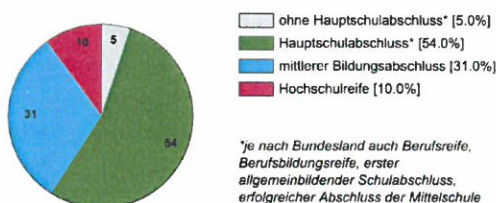
Ausbildungsbereich Industrie und Handel